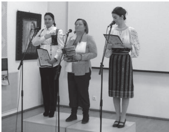
Aspect de la vernisaj.

Organizatorii acestui eveniment au fost sprijiniți de Tycoon Communications și Hemingway care au conlucrat cu Muzeul Național al Satului „Dimitrie Gusti” la