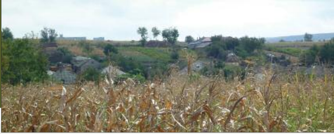
Cataloi – Scorcio della zona dove si erano insediati coloni italiani

Era o zi călduță de început de septembrie când am revenit la Cataloi. Era o întâlnire colectivă, cu autorități religioase și civile locale și cu unii dintre reprezentanții descendenților comunității italiene care gravitează în zonă; despre această întâlnire și despre finalitatea ei vor vorbi alții mai bine decât mine.