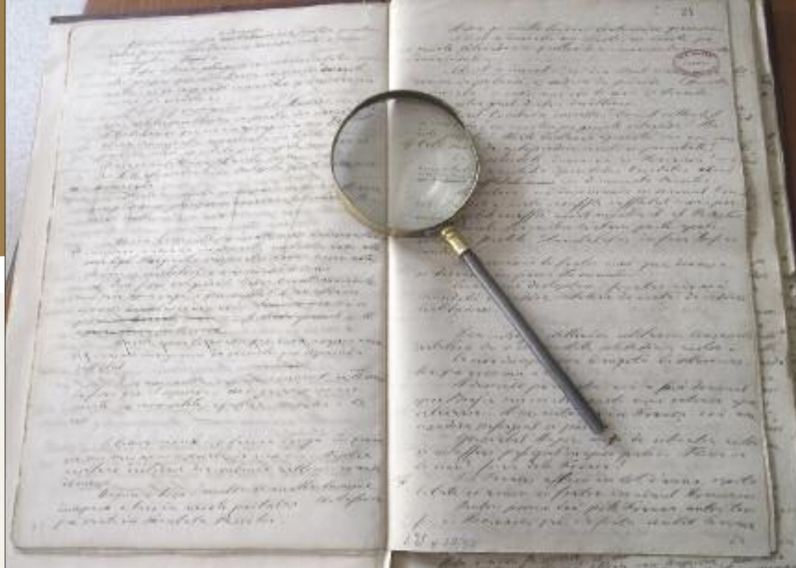
Suvenirile unui proscris, I.H. Rădulescu, sub lupa lui Perspessicius

răsbumba ultima trumbă / Quare quele mai închise morminte investe și desferră / Și fie-quare sbura-va și corbu și columba / În valea quea mare la vecinica pace au durere”.