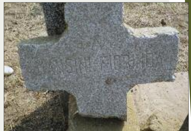
Enrico (probabil) – 1869 Vichioli (probabil) – 18 ani Mansini Fiorinda